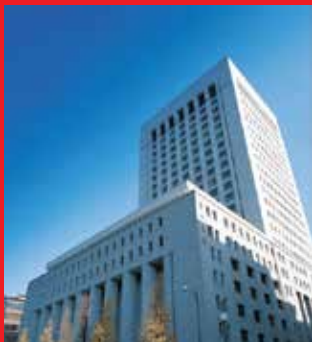
Tòa nhà trụ sở Dai-ichi Life Holdings tại Tokyo, Nhật Bản