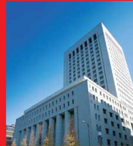
Tòa nhà trụ sở Dai-ichi Life Holdings tại Tokyo, Nhật Bản

Dai-ichi Life được thành lập vào năm 1902, là công ty bảo hiểm nhân thọ (BHNT) tương hỗ đầu tiên của Nhật Bản (Dai-ichi Mutual Life Insurance Company, Limited). Dai-ichi Life rời khỏi cơ cấu công ty tương hỗ, cổ phần hóa và niêm yết trên thị trường chứng khoán Tokyo vào năm 2010, và chuyển sang cơ cấu công ty cổ phần vào năm 2016 (Dai-ichi Life Holdings Inc.). Dai-ichi Life Holdings Inc. là một trong những tập đoàn BHNT hàng đầu tại Nhật Bản với tổng giá trị tài sản 461 tỷ đô-la Mỹ, doanh thu phí bảo hiểm đạt hơn 50 tỷ đô-la Mỹ (tính đến ngày 31/03/2023).