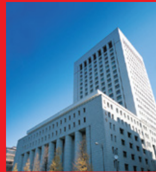
Tòa nhà trụ sở Dai-ichi Life Holdings tại Tokyo, Nhật Bản