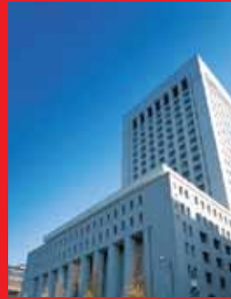
Tòa nhà trụ sở Dai-ichi Life tại Tokyo, Nhật Bản

Được thành lập vào năm 1902 dưới hình thức công ty bảo hiểm nhân thọ ("BHNT") tương hỗ đầu tiên tại Nhật Bản, The Dai-ichi Life Insurance Company, Limited ("Dai-ichi Life") là một trong những công ty BHNT hàng đầu tại Nhật Bản cũng như trên thế giới với tổng tài sản trị giá 379,5 tỷ đô la Mỹ và tổng doanh thu đạt 38,7 tỷ đô la Mỹ (tính đến ngày 31/3/2013).